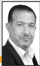
به قلم سید کریم محمدی فعال فرهنگی و اجتماعی