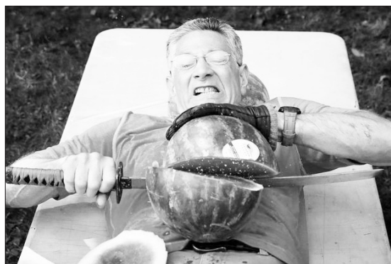
رکورد بریدن هندوانه روی شکم