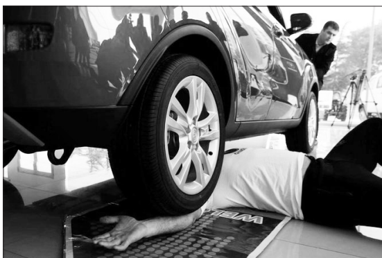
رکورد لاستیک ماشین روی بازو